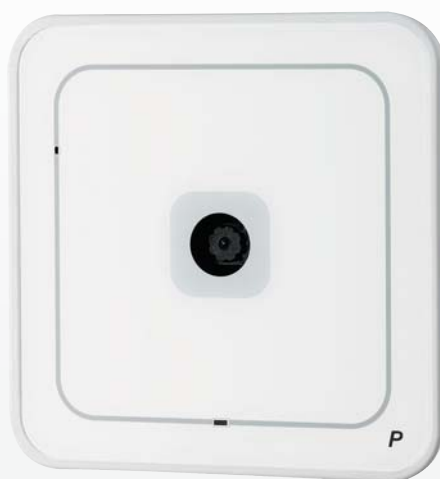
GGM CAMW08 (WI-FI)