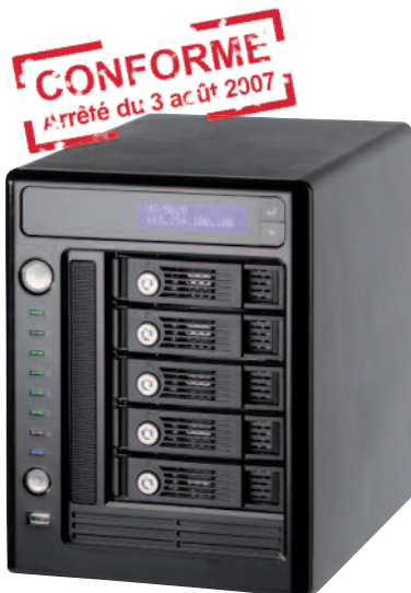
Gestion 20 caméras IP

Combiné aux caméras réseau GIGAMEDIA, l'enregistreur vidéo sur IP GGM NVR20CAM apporte une solution de surveillance complète permettant de repérer les vols, renforcer la sécurité du personnel et de contrôler des infrastructures à distance. Le système convient parfaitement à la surveillance d'entreprises, magasins, hôtels, musés, écoles et autres lieux demandant une réelle surveillance vidéo professionnelle.