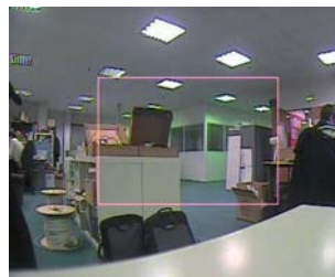
Réglage détection de mouvement