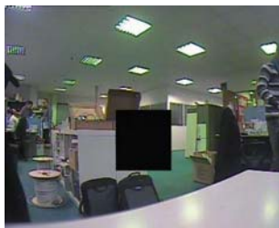
Réglage masque privé