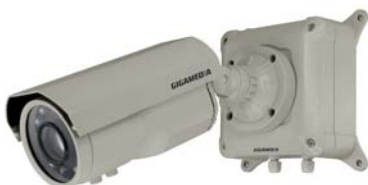
INSTALLATION AVEC LA CAMÉRA GGM CCC618VW600