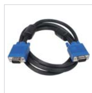
CABLE VGA (1,5M)