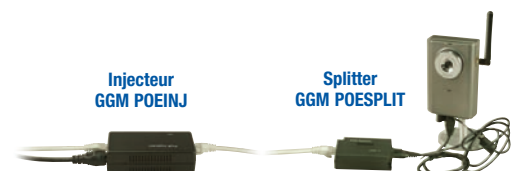
Injecteur GGM POEINJ

Le PoE vous permet ainsi d'installer vos produits réseau LAN (switch, caméras IP) ou WLAN "sans fil" (points d'accès, ponts et routeurs) aux endroits difficilement accessibles tels que les toits des bâtiments, les plafonds ou les faux-plafonds.